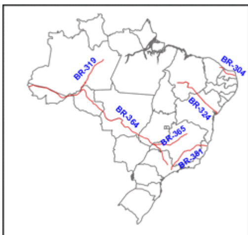
Figura 4 – Rodovias Radiais

Estas rodovias podem apresentar dois modos de orientação: Noroeste-Sudeste ou Nordeste-Sudoeste.