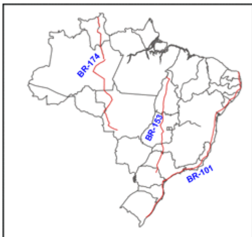
Figura 2 – Rodovias Longitudinais