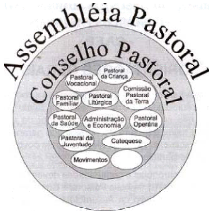
Figura 2: Estrutura das Dioceses, Paróquias e Comunidades em geral