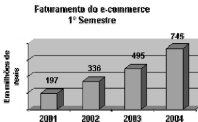
Figura 1: Faturamento do e-commerce