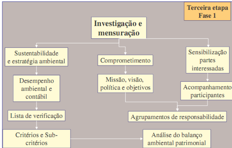
Figura 2 - Estrutura da Primeira Fase – Terceira Etapa

A fase da investigação e mensuração é subdividida em três ações, a primeira que busca identificar a sustentabilidade e estratégia ambiental, a segunda que busca o comprometimento das partes envolvidas, seguida pela sensibilização das mesmas, conforme descrito na Figura 2.