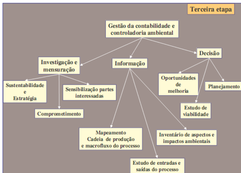
Figura 1- Estrutura da terceira etapa Fonte: Pfitscher (2004, p. 119)

A terceira e última etapa é a da Gestão da Contabilidade e Controladoria Ambiental e é dividida em três fases: investigação e mensuração, informação e decisão, conforme apresentado na Figura 1.