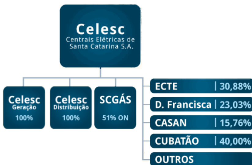
Figura 8 - Estrutura CELESC

A Figura 8 demonstra a estrutura da CELESC, que detém ainda o controle acionário da Companhia de Gás de Santa Catarina - SCGAS, e participações acionárias nas empresas Dona Francisca Energética S.A. - DFESA, Empresa Catarinense de Transmissão de Energia Elétrica - ECTE, Companhia Catarinense de Água e Saneamento - CASAN, e Usina Hidrelétrica Cubatão S.A., além de outras pequenas participações acionárias. (CELESC, 2011)